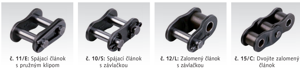
č. 11/E: Spájací článok s pružným klipom

Informácie potrebné na objednanie: napr.: Produkt č. 100 803 00W, Spájací článok č. 11/E, GT4, 05 B-1